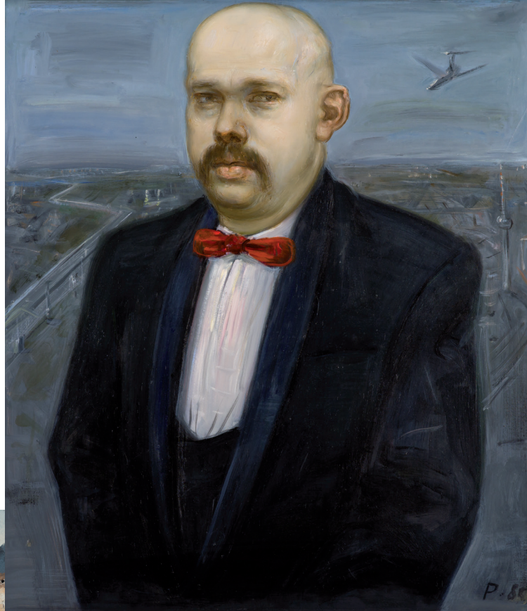
Wolfgang Peuker, Selbst im Smoking, 1985 Öl auf Hartfaser, 75 x 66 cm, Kunstsammlung der Berliner Volksbank K 266

Einen ungewöhnlichen Hintergrund bilden die Maueranlagen auf dem provokanten Selbstbildnis von Wolfgang Peuker aus dem Jahr 1985. Der Künstler inszenierte sich vor einem Stadtbild aus der Vogelperspektive, das ungeschönt die Realität der Teilung abbildet.