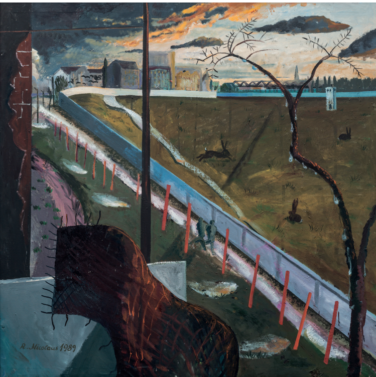
Roland Nicolaus, Potsdamer Platz „Ein Platz für Tiere“, 1989 Öl auf Leinwand, 140 x 140 cm, Stiftung Stadtmuseum Berlin

Der Leipziger Wolfgang Mattheuer schuf dagegen in den 1980er Jahren Bildkompositionen, die Stimmungen aufgriffen und Sehnsüchten Ausdruck verliehen. In „Und die Flügel ziehen himmelwärts“ versuchen Eingespernte, ihrer Lage zu entkommen. Sie stehen jedoch vor einem Abgrund. Ein unüberwindbar scheinendes Hindernis und der Drang auszubrechen stehen sinnbildhaft für die Situation vieler Menschen in der DDR.