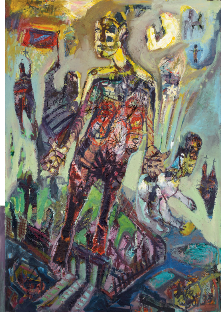
Werner Liebmann, Himmelfahrt, 1990/91 Öl auf Hartfaser, 180 x 125 cm, Kunstsammlung der Berliner Volksbank 166

Die Ausstellung „ZEITENWENDE“ zeigt Gemälde und Grafik aus der Kunstsammlung der Berliner Volksbank sowie Leihgaben aus öffentlichem und privaten Besitz.