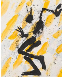
Helge Leiber, Goldregen, 1994, Acryl auf Leinwand, Kunstsammlung der Berliner Volksbank K 891 Werkfoto: Peter Adamik, © VG Bild-Kunst, Bonn 2022