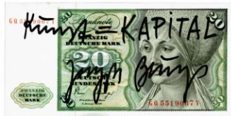
Joseph Beuys, Kunst=Kapital 1979, Originalbanknote, von Hand beschriftet, Sammlung Haupt, Berlin, Werkfoto: Hermann Büchner, © VG Bild-Kunst, Bonn 2022