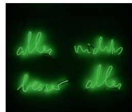
Via Lewandowsky, Oder so, 2021, RENÉ SCHMITT Berlin, Werkfoto: Via Lewandowsky © VG Bild-Kunst, Bonn 2022