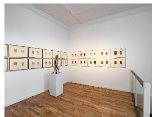
Ausstellungsansicht „CASH on the Wall“ Stiftung Kunstforum Berliner Volksbank © VG Bild-Kunst, Bonn 2022, © Nachlass Horst Hüssel, Nachlass Michael Schoenholtz