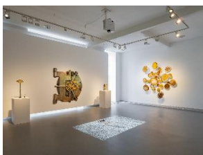
Ausstellungsansicht „CASH on the Wall“ Stiftung Kunstforum Berliner Volksbank © VG Bild-Kunst, Bonn 2022, © Anne Jud, Anahita Razmi, Lies Maculan, Thomas Eller.