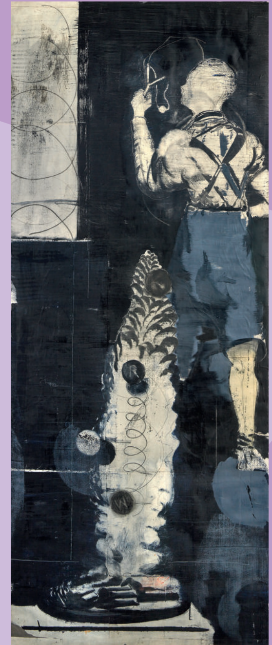
Neo Rauch, Der blaue Junge, 1995 Mischtechnik auf Papier auf Holz, 271 x 109 cm Leihgaben der Kunststiftung Michels

The focus is on works from the 1980s and 1990s, which underline the emphasis of the Kunstsammlung der Berliner Volksbank. Loans from the Kunststiftung Michels also provide selected insights into artistic positions of the early 20th century. Both, different socio-political circumstances as well as individual approaches led to diverse further developments of central ideas of Expressionism. In the image of man, the figurative works from different decades illustrate the attitude to life of this time.