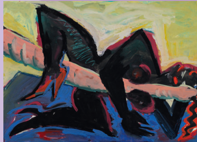
Elvira Bach, Blaue Mamba, 1983 Tempera und Pastell auf Karton, 49,7 x 69,3 cm Kunstsammlung der Berliner Volksbank K 1506

The exhibition MENSCHENBILD – der expressionistische Blick (the expressionist view) pays special attention to paintings, sculptures and works on paper that are dedicated to the theme of the figure in expressive depictions.