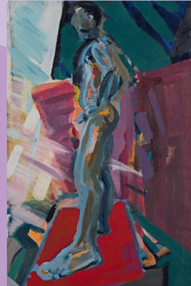
Titelabbildung: Norbert Bisky, Untitled, 1993, Acryl auf Papier, 95 x 61 cm Kunstsammlung der Berliner Volksbank K 1499 © VG Bild-Kunst, Bonn 2023 (Elvira Bach, Norbert Bisky, Claudia Busching, Neo Rauch)