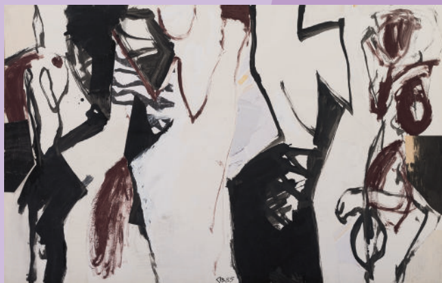
Claudia Busching, Ohne Titel (Figuren), 1985 Acryl, Holzschnitt und Collage auf Papier, 96 x 152 cm Kunstsammlung der Berliner Volksbank K 1485

Im Fokus stehen Exponate aus den 1980er- und 1990er-Jahren, die den Sammlungsschwerpunkt der Kunstsammlung der Berliner Volksbank unterstreichen. Leihgaben der Kunststiftung Michels ermöglichen zudem ausgewählte Einblicke in künstlerische Positionen des frühen 20. Jahrhunderts. Sowohl unterschiedliche gesellschaftspolitische Umstände als auch individuelle Herangehensweisen führten zu vielfältigen Weiterentwicklungen zentraler Ideen des Expressionismus. Die figürlichen Werke aus unterschiedlichen Jahrzehnten veranschaulichen im Menschenbild jeweils das Lebensgefühl ihrer Zeit.