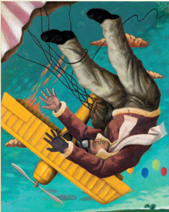
Thomas Schindler, Ikarus II, 2004, Öl auf Leinwand, © Stiftung Kunstforum Berliner Volksbank, K 1335, Foto: Peter Adamik

Lasst euch während der Führung inspirieren und in eurer Fantasie beflügeln. Guckt genau hin, nehmt euch Zeit und merkt euch, was ihr gesehen habt. War es ein Auge, ein Kopf oder doch eine Hand? Ist da etwa ein Flugzeug durchs Bild geflogen oder haben Gespenster aus dem Haus geguckt?