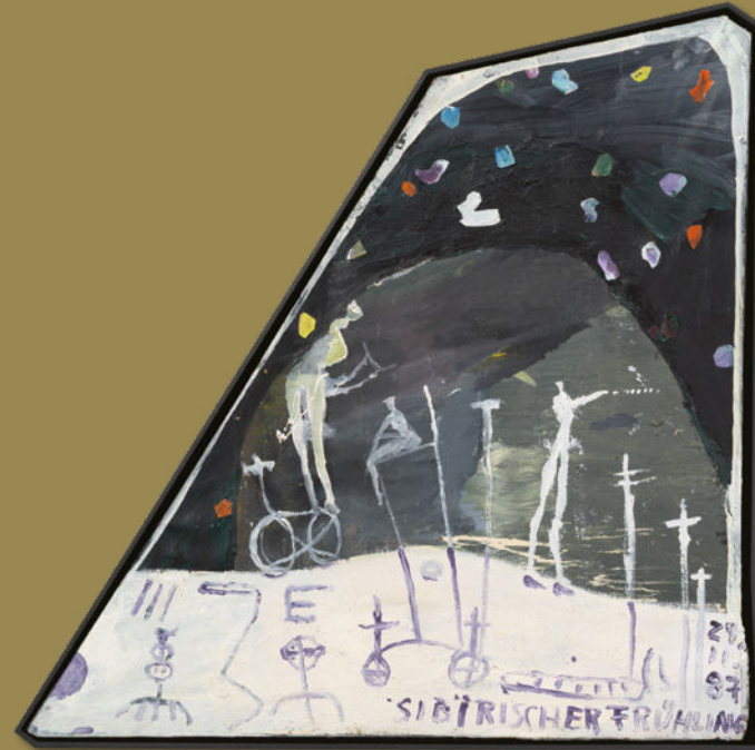
Cornelia Schleime, Sibirischer Frühling, 1987 Kunstsammlung der Berliner Volksbank K 1477