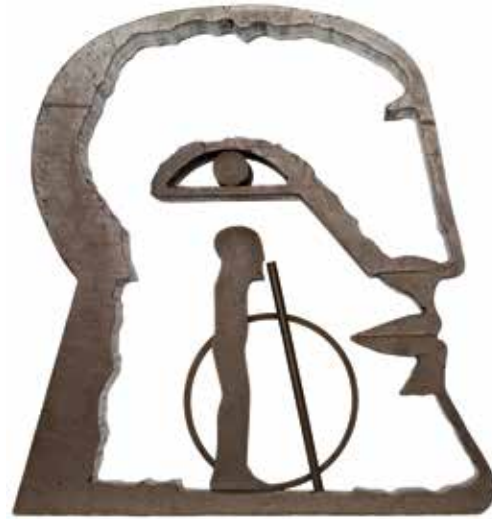
Horst Antes, Kopf mit stehender Figur, Reif und Stab, 1979/80 Stahl, 61 x 57 x 13 cm Kunstsammlung der Berliner Volksbank K 571

Seit der Moderne gehen Künstlerinnen und Künstler immer freier mit dem Thema Kopf um. In der Ausstellung ist ein breites Spektrum von Darstellungen eines der ältesten Motive der Kunstgeschichte zu sehen. Dabei geht es nicht um Bildnisse im klassischen Sinn. Vielmehr werden künstlerische Arbeiten und Werke gezeigt, die Form und Bedeutung des Themas erweitern und die Physiognomie frei interpretieren.