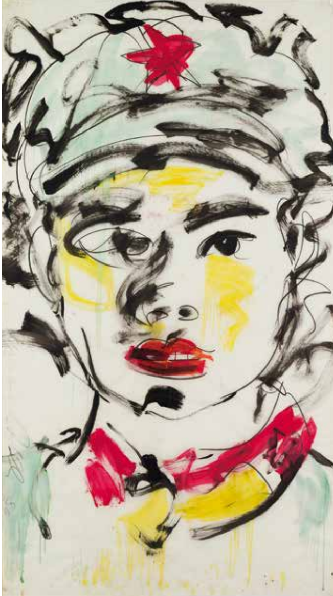
Luciano Castelli, Chinesisches Porträt, 1986 Mischtechnik auf Transparentpapier, 270 x 155 cm Kunstsammlung der Berliner Volksbank K 939

In der Ausstellung „Tête-à-Tête – Köpfe aus der Kunstsammlung der Berliner Volksbank“ werden Kunstwerke gezeigt, die Köpfe und Gesichter darstellen. Freidenker und Sterndeuter, Stadtköpfe und Hutträger auf Papier oder Leinwand sowie Skulpturen aus Beton, Glas und Stahl vermitteln einen Eindruck der Vielfalt.